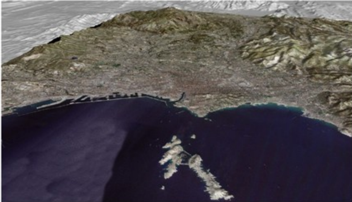
Basculer la ville vers le littoral