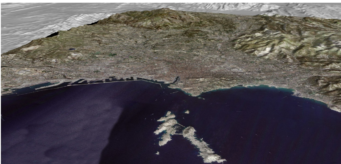
Faire basculer la ville vers ses 2 frontières naturelles: le littoral, et la lisière avec la colline

Création de parcs linéaires sur la lisière de la ville avec la colline, épaissement du littoral, inscription des grands points de vue sur les documents d'urbanisme...: réflexions et propositions pour développer à Marseille un projet urbain qui valoriserait encore davantage ce qui est peut-être sa plus grande ressource: son site. Même après plusieurs millénaires, la ville a encore beaucoup à apprendre des Calanques, des collines et de la mer. Les nouveaux territoires de la ville sont là depuis toujours. Nous commençons seulement à les voir. Leçon de paysage.