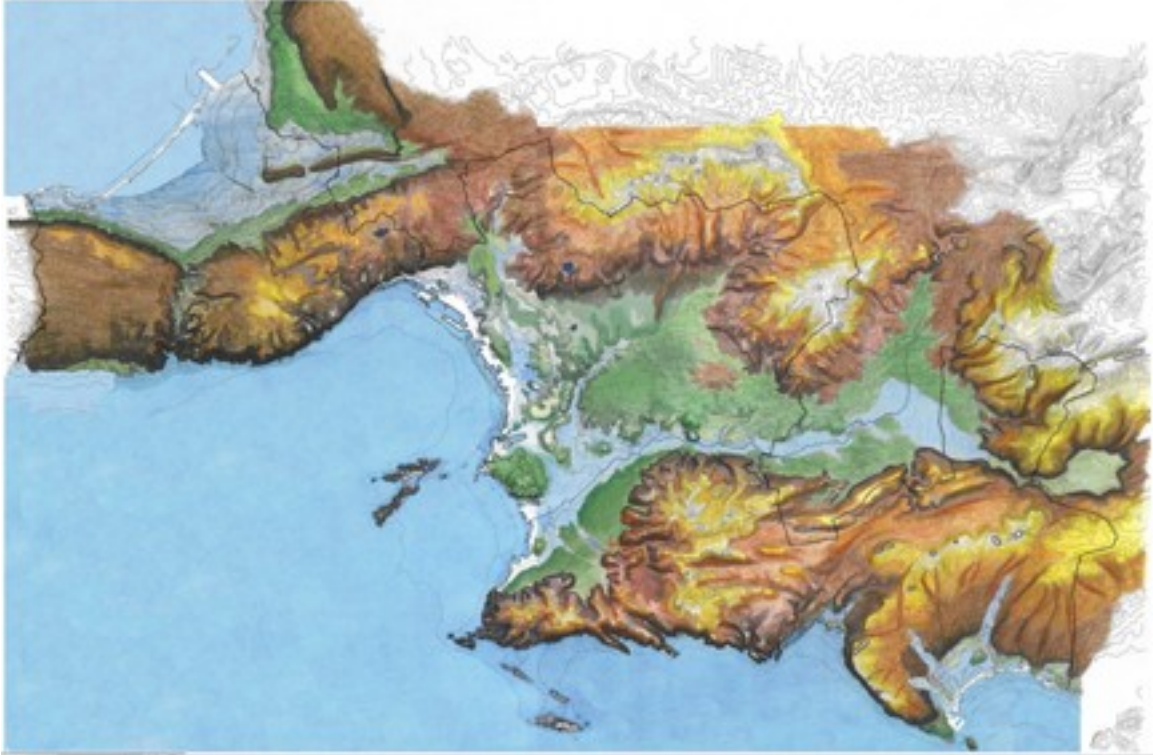
Marseille au naturel: reliefs et cours d'eau

En pratique, ça signifie là aussi qu'il faut les relever et les noter sur un plan, faire qu'on n'y construise pas et, idéalement, créer des parcs linéaires.